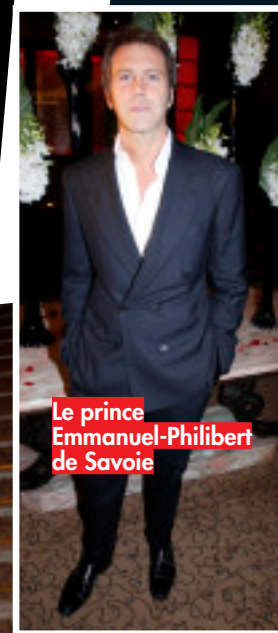
Le prince Emmanuel-Philibert de Savoie