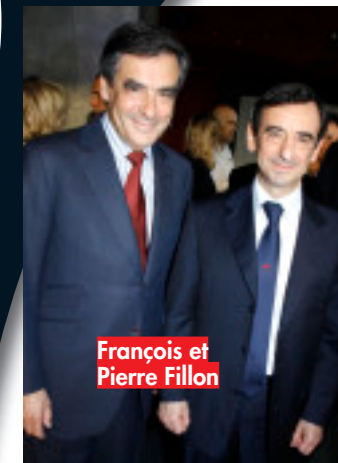
François et Pierre Fillon